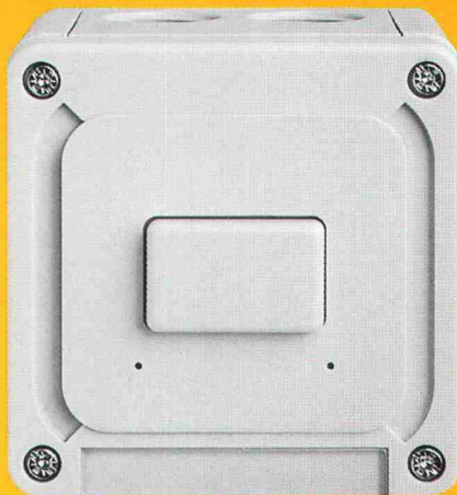
Schalter MAP 84 x 84 mm, Höhe 68 - 86 mm

Die Systemelemente lassen sich mittels Zwischenrippel beliebig kombinieren , können mit seitlichen Bohrungen versehen werden und tragen immer ein Bezeichnungsschild. Qualität bis ins Detail.