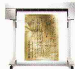
HP DesignJet 488CA