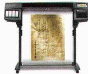
HP DesignJet 1055CM