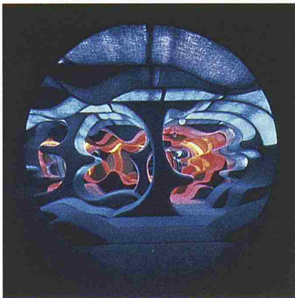
Oben: Rollensessel mit Marianne Panton, 1963 (Bild: Panton Design). Mitte: Verner Panton in seinem Livingtower, 1969 (Bild: Vitra). Unten: Phantasy Landscape an der Visiona II, Möbelmesse Köln 1970 (Bild: Panton Design)

Ungewohnt und fröhlich präsentieren sich zurzeit die Räume des Vitra Design Museum in Weil am Rhein. Grund dazu bietet die Retrospektive des Werks Verner Pantons. Der dänische Architekt und Möbeldesigner, der mit vielen internationalen Design-Preisen ausgezeichnet wurde, lebte lange Jahre in der Nähe von Basel. Er arbeitete bis zu seinem Tod 1998 im Alter von 72 Jahren. Sein architektonisches Werk ist für die Ausstellung von zweitrangiger Bedeutung, soll aber zusätzlich in einer im Mai erscheinenden Monografie im Werkverzeichnis 1 gewürdigt werden. Ganz im Sinne Pantons wollten die Ausstellungsmacher ein möglichst eindrucksvolles und sinnliches Erlebnis anbieten und legten grossen Wert auf die Ausstellungsgestaltung, die ihnen auch gelungen ist.