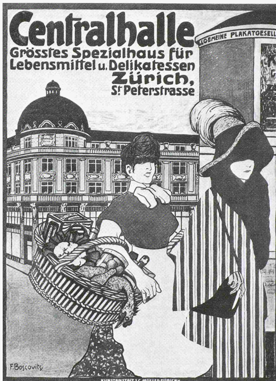
«Centralhalle». Plakat von Fritz Boscovits, 1906

Dieser Entstehungszusammenhang zeitigte die eigentliche «Entdeckung» von Frauen als Konsumentinnen. 10 Es galt, gerade Frauen der kaufkräftigeren Schichten nicht nur ins Warenhaus zu locken, sondern sie auch zum Verweilen und vor allem zum Konsumieren zu verführen. 11 Dies geschah mittels gezielt eingesetzter raumgestalterischer Elemente, die das Ambiente bürgerlicher Privaträume reflektierten: Das Jelmoli-Gebäude war geschlossen und klar vom städtischen Raum abgegrenzt, um eine Atmosphäre von Schutz und Sicherheit zu vermitteln. Die Glasarchitektur entsprach dem bürgerlichen Repräsentationsbedürfnis, während die Infrastruktur mit einem Erfrischungsraum, mehreren Damentoiletten auf jedem Stockwerk und dem omnipräsenten, stets zu Diensten stehenden Verkaufspersonal auch höchsten bürgerlichen Komfortansprüchen zu genügen trachtete. Luxuriöse exotische