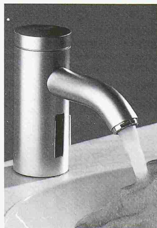
Fürs Badezimmer zu Hause geeignet: Sensor-Wasserhahn von Aquis

Aquis GmbH 9445 Rebstein Tel. 071 775 91 21