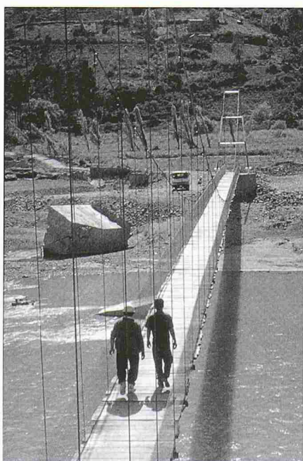
Die Brücke über den Río Paute in Ecuador hat eine Spannweite von 100 m

Rüttimann: Ich wählte Hängebrücken wegen der benötigten Spannweiten, weil sie ohne schweres Gerät auskommen und weil die benötigten Baumaterialien sich unter den Dingen finden, die die Ölgesellschaften wegwerfen.