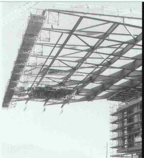
Projekt: Kultur- und Kongresszentrum Luzern Architekt: Jean Nouvel, Paris

Nur mit diesem Baustoff sind die grössten Spannweiten möglich, dies mit Berücksichtigung der Wirtschaftlichkeit und des vorteilhaften Leistungsgewichtes. Stahl bietet eine nahezu unerschöpfliche Fülle von Möglichkeiten, Ihre Ideen zu verwirklichen.