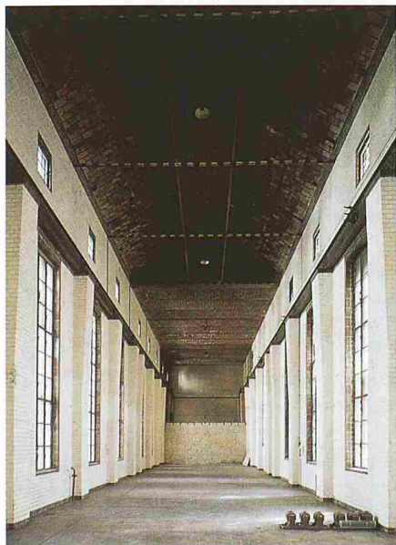
Die Hauptausstellungsfläche in der ehemaligen Maschinenhalle umfasst rund 700 m 2 (links). Die ehemalige Schaltwarte (rechts) wird für Empfänge, Konferenzen und andere Veranstaltungen genutzt

Das Vitra Design Museum Berlin befindet sich an der Kopenhagener Strasse 58/Ecke Sonnenburger Strasse. Die Eröffnungsausstellung über Verner Panton läuft vom 1. Juli bis zum 17. Oktober, Öffnungszeiten sind Dienstag bis Sonntag, 10 bis 20 Uhr.