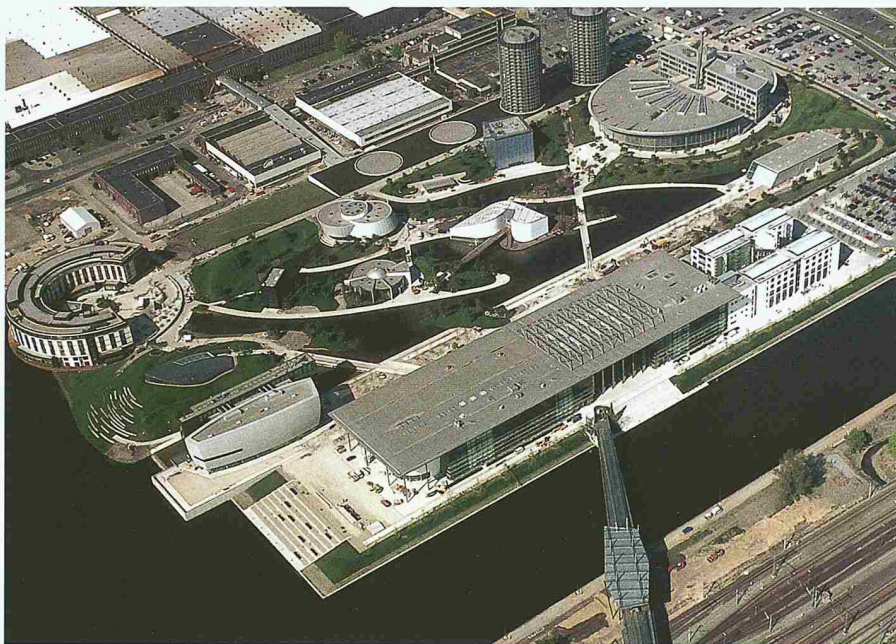
Volkswagen-«Autostadt» mit Grossbauten, Markenpavillons und Parklandschaft (Henn Architekten Ingenieure, Berlin, München). Vorne Stadtbrücke zum Bahnhof und Stadtzentrum, hinten VW-Werkgelände