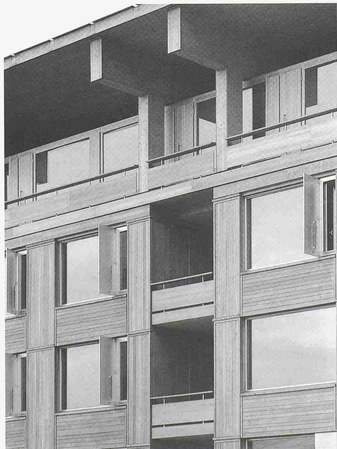
Das neue Lehrgebäude der SH-Holz sorgte weit über die Grenzen der Schweiz für Aufsehen. Für die Teilnehmer des Nachdiplomstudiums Holz ist es ein idealer Ort, um sich mit den Möglichkeiten des Holzhausbaus auseinanderzusetzen

Nächster Studienbeginn: 23. Oktober 2000. Weitere Auskünfte: Urs Luedi dipl. Architekt ETH/SIA, Leiter NDS-Holzbau, Abteilung FH NDS-Holzbau, Solothurnstrasse 102, 2504 Biel, Telefon 032 344 03 72, Fax 032 344 03 90, office@swood.bfh.ch, www.swood.bfh.ch