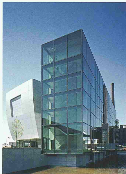
Oben der Lamborghini-Pavillon (Henn Architekten in Zusammenarbeit mit Bellprat, Winterthur); unten das Zeit-Haus, wo die Auto-Show stattfindet