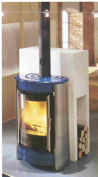
Cheminéofen Olivia der Hico AG

Bauknecht AG 5600 Lenzburg Tel. 062 888 31 31 Halle 3, Stand 327