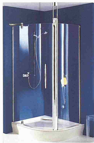
Gläseinbaudusche Magna 3000 von Hüppe

Amacher AG 4123 Allschwil Tel. 061 487 46 40 Halle 4, Stand 418