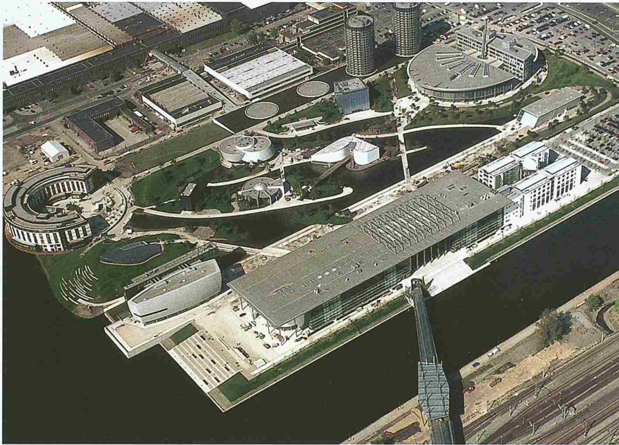
Volkswagen-«Autostadt» mit Grossbauten, Markenpavillons und Parklandschaft (Henn Architekten Ingenieure, Berlin, München). Vorne Stadtbrücke zum Bahnhof und Stadtzentrum, hinten VW-Werkgelände