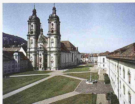
Stiftsbezirk St. Gallen, barocke Kathedrale und Klosterhof

wichtig, diese positive Seite zu unterstreichen. Die Welt rückt – nicht zuletzt übers Internet – näher zusammen. Junge Leute sollen deshalb bereits in der Schule erfahren, dass es nicht nur im eigenen Land das Berner Münster, sondern auch in fernen Ländern ebenso bedeutende Kulturstätten gibt, vielleicht mit dem Unterschied, dass sich niemand darum kümmert.