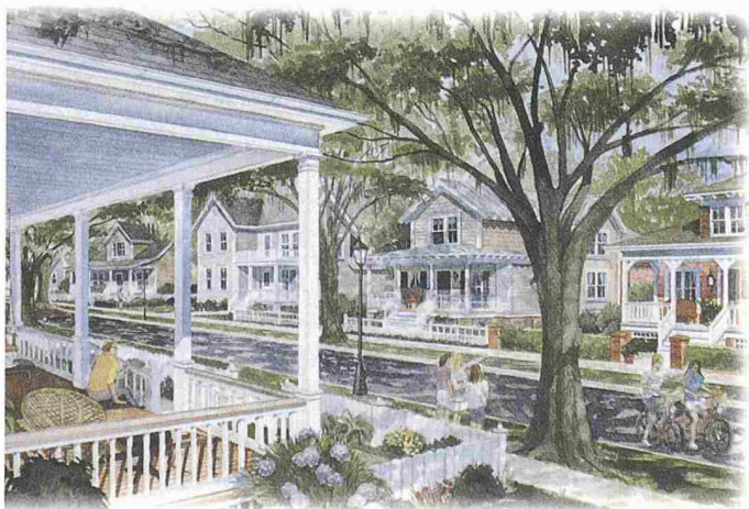
Habersham on the Broad River. Investorenprospekt