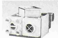
ABB Ventilatoren mit Wärmerückgewinnung 400 m 3 /h, motorlose, lärmfreie Abzugshauben = die perfekte Lösung! – Offerte von:

ANSON DECOR Abzugshauben für designbetonte Küchen und Kochinsel. 400–1000 m 3 /h. Auch inox+farbig.