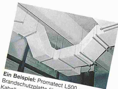
Ein Beispiel: Promat L500 – Brandschutzplatte für Lüftungs- und Kabelkanäle.

Zubehör-Sortiment: Rohrschalen, Manschetten, Kabelabschottungen, Mörtel, Kitte, Imprägnierungen, Dämmstreifen und vieles mehr.