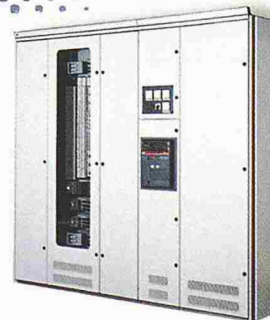
Die MNS® Sprint – die kostengünstige Variante

Ob im Niederspannungs-, Not- und Ersatzstrom- oder Starkstrombereich, seit Jahren setzen wir neue Maßstäbe im Anlagenbau.