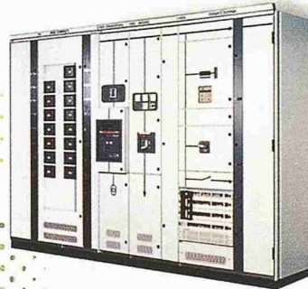
MNS® – das modulare Niederspannungssystem