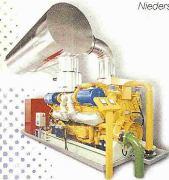
Not- und Ersatzstromanlagen