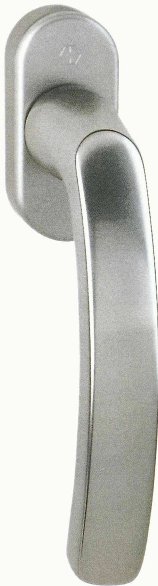
Fenstergriff Secustik mit Warnton der Hoppe AG

Hoppe AG 7537 Müstair 081 851 66 00 www.hoppe.ch Halle 1.0, Stand C 04