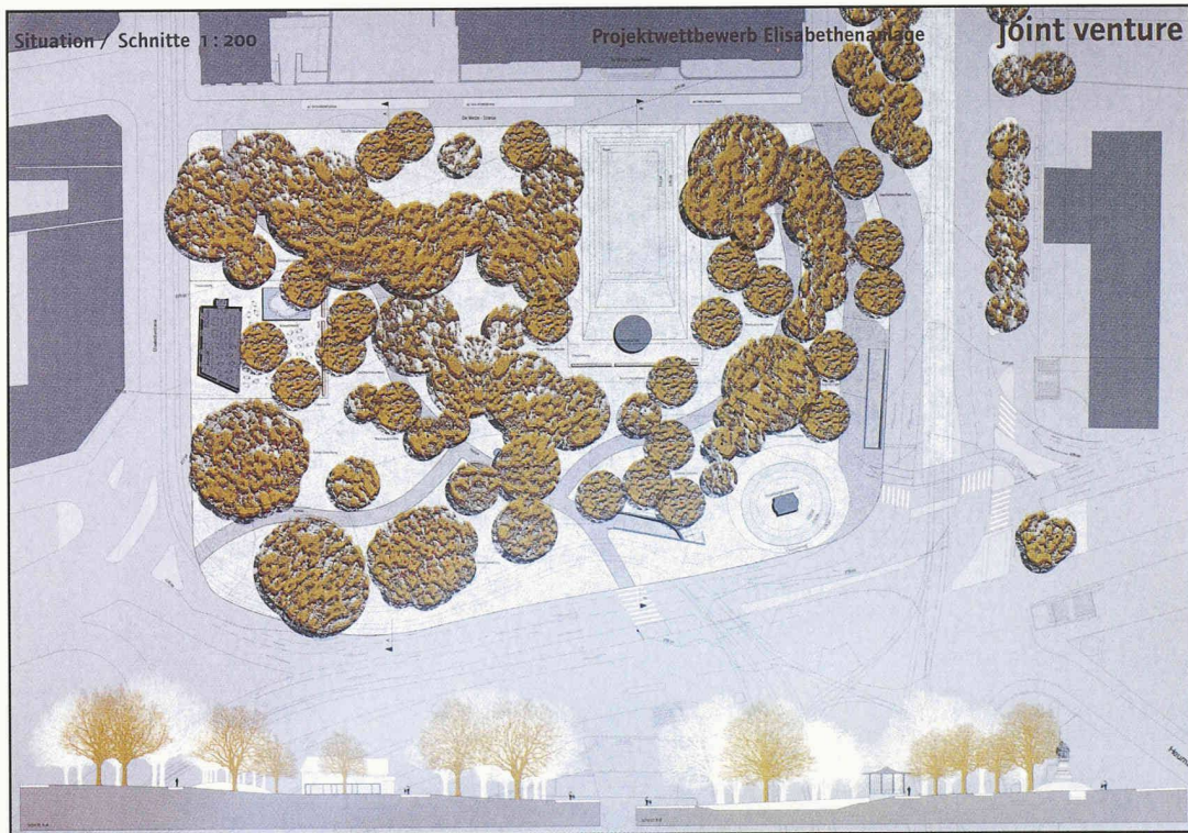
1. Preis (Empfehlung zur Weiterbearbeitung): Team Vogt und Partner aus Zürich