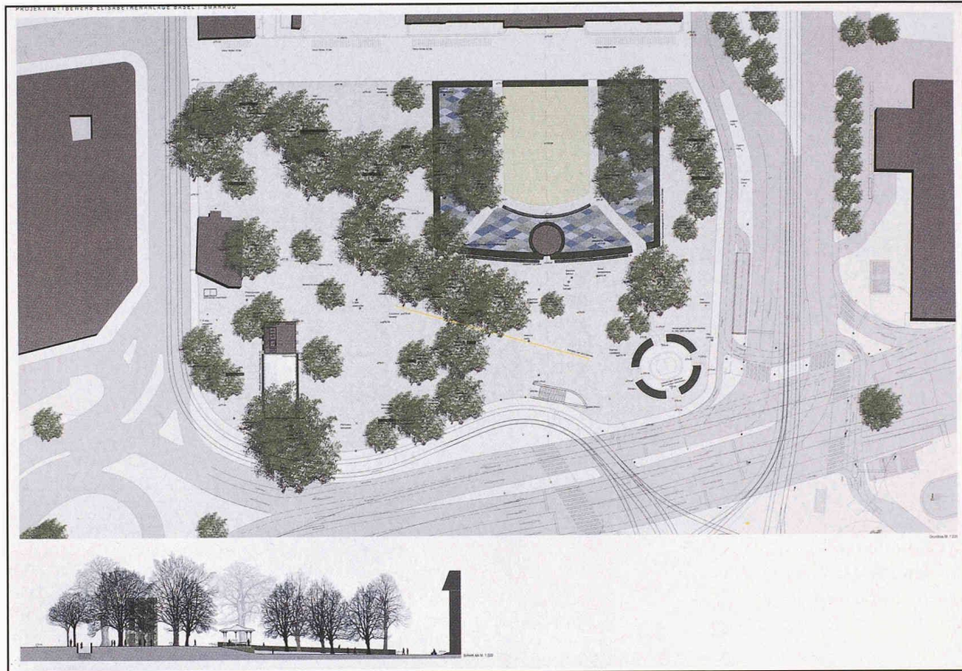
4. Preis: Team Guido Hager aus Zürich