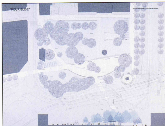
3. Preis: Team Fahrni und Breitenfeld aus Basel