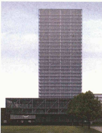
Der Messturm Basel von Morger & Degelo und Daniele Marques wird ab Oktober 2002 das höchste Haus der Schweiz sein, der Grundstein ist gelegt

(pd) Am 26. Oktober erfolgte in Basel die Grundsteinlegung für den Messturm am Messeplatz in Kleinbasel. Der 105 m und 31 Geschosse hohe Büro- und Hotel-turm wird bis im Oktober 2002 das höchste Haus in der Schweiz sein. Ab März 2003 soll er bezugsbereit sein, danach folgt der Ausbau durch die Mieter.