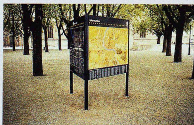
In Basel wurde 1980 das erste stadtübergreifende Informationssystem für Fussgänger eingerichtet (Bild: Hauptorientierung Münsterplatz)

19.12., 17–19 h, im Auditorium Hotel Hilton, Basel; Tel. 031 990 32 32 (HGKK)