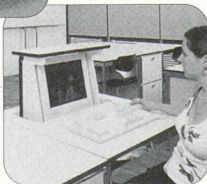
«Techno B» Flach-Bildschirm in Tischplatte versenkbar (Teleskopmechanik)

Weitere Informationen zu beiden Modellen und zu unserem übrigen Programm gibts unter www.zesar.ch oder bei