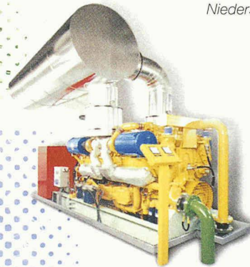
Not- und Ersatzstromanlagen