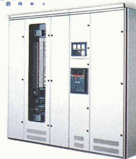
Die MNS® Sprint – die kostengünstige Variante

Ob im Niederspannungs-, Not- und Ersatzstrom- oder Starkstrombereich, seit Jahren setzen wir neue Maßstäbe im Anlagenbau.