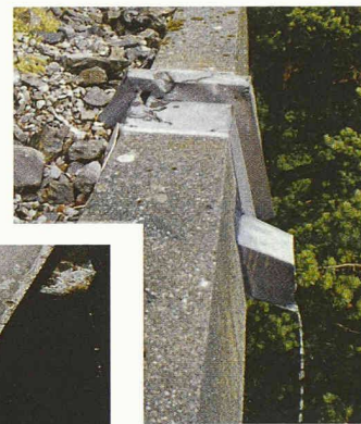
Die Dachentwässerung einer Galerie weist einen konstruktiven Mangel auf, so dass aufgestautes Wasser durch die Dilatationsfugen an die Untersicht gelangt