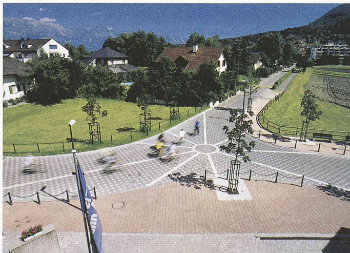
Farbige Pflasterungen sollen in Vaduz den zunehmenden Verkehr beruhigen und obendrein das Ortsbild verschönern