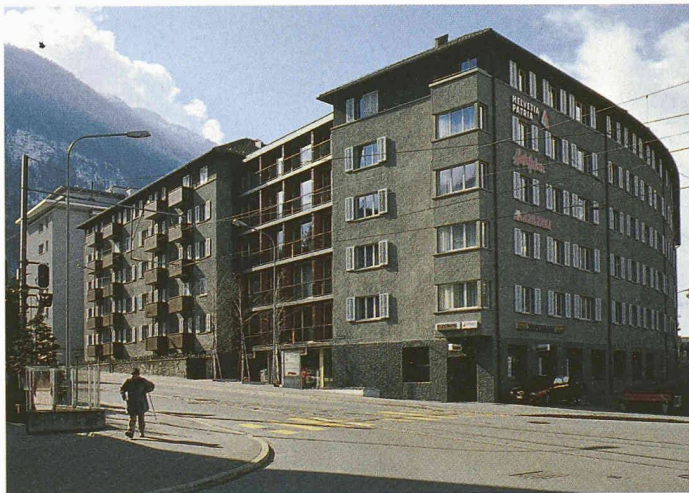
Der Wohnkomplex Tivoli in Chur aus den 1940er-Jahren: Beispiel für eine zurückhaltende Sanierung, mit der attraktive, zeitgemässe Stadtwohnungen geschaffen werden konnten