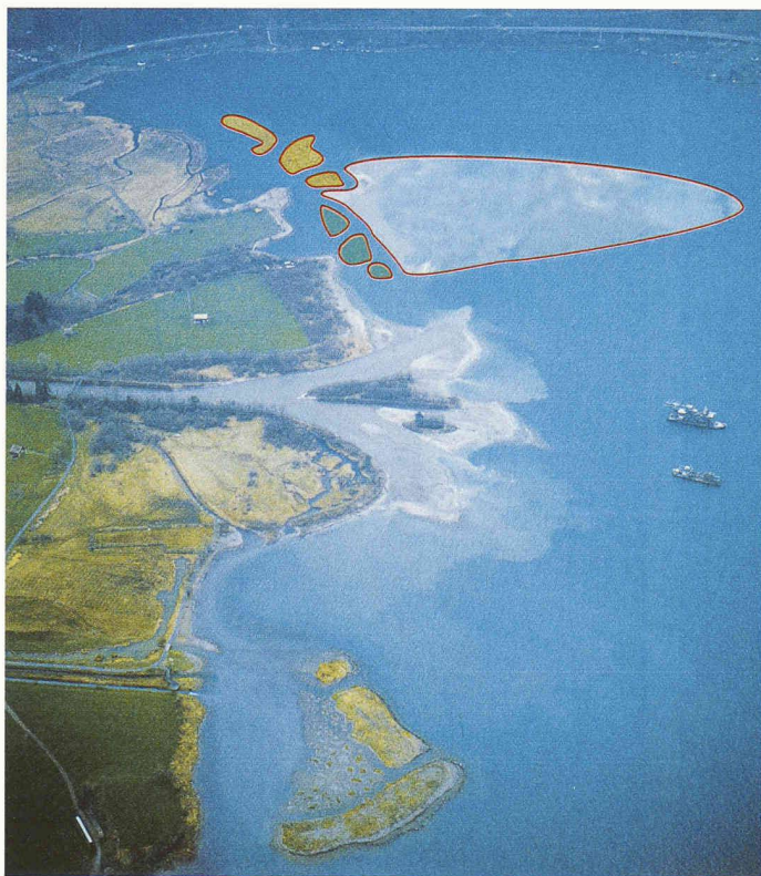
Das Reussdelta, rot eingezeichnet die neuen Aufschüttungen: drei Inseln mit Naturschutzgebiet gegen die Seedorfer Bucht (gelb), drei Inseln als Erholungsgebiet (grün) und vorgelagert ein grosses Flachwassergebiet als Lebensraum für Wasserpflanzen und Fische

(sda/dpa/rw) Die Planung von Ottomar Lang zur «Wiedergeburt» des Reussdeltas im Vierwaldstättersee wird vom Bund Deutscher Landschaftsarchitekten (BDLA) mit einem ersten Preis ausgezeichnet. Das seit 1983 laufende ökologische und ästhetische Projekt sei einzigartig, in hohem Masse landschaftsgestaltend, überzeugend in der Darstellung und habe Signalwirkung für die Zusammenarbeit mit anderen Disziplinen, begründete die Jury die Vergabe des nicht dotierten Preises. Im Reussdelta-Projekt würden mehrere Ziele miteinander verbunden: Die Renaturierung eines fast verlorenen Landschaftsraums, dessen Erschliessung zu Naherholungszwecken sowie die ökologische Baustoffbeseitigung – für Schüttinseln im Delta wird Ausbruchmaterial aus dem Gotthard-Tunnel verwendet. (SI+A,