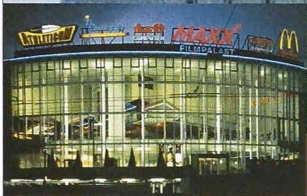
MaXX Filmpalast Emmenbrücke

Dahinter steckt unsere Liebe zur Präzision.