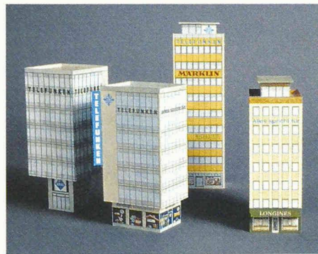
Hochhäuser aus den 1950er und 1960er Jahren. 1968. Massstab H0/1:87. Gebaut ca. 11x10x31 cm