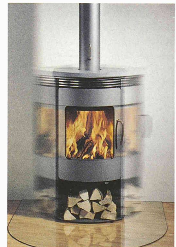
Der drehbare Cheminéeofen Gabo der Attika Feuer AG

Attika Feuer AG 6312 Steinhausen 041 749 99 99 www.attika.ch Halle 3.U, Stand E 44