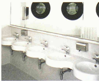
Waschtisch der Romay AG mit integrierter Ablage und Rückwand

Romay präsentiert Gesamtlösungen für Waschtische und Waschplätze im öffentlichen und halb-öffentlichen Bereich, wie öffentliche Toiletten, Sanitäranlagen in Verwaltungsgebäuden, in der Gastronomie, im Gewerbe, Heimen und Sportzentren. Die Waschtische Marello mit integrierter Ablage sind mit 1, 2, 3 oder 4 Becken erhältlich. Die Ablagemöglichkeiten können auf die individuellen baulichen Situationen abgestimmt werden. Die Waschtische Marello sind mit Verbindungsstücken erweiterbar, wie