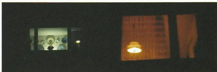
Fiktion oder Wirklichkeit? – Innenräume in Bottmingen