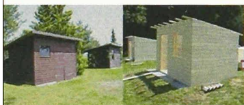
Spiegel des vorstädtischen Lebens

muss Kommunikation ermöglicht werden, unter anderem durch entsprechend konzipierte Räume: Nebst dem Haupthaus, das um eine offene Feuerstelle herum entsteht und jeweils mittwochs zu Veranstaltungen mit Gastwirtschaft einlädt, werden zwei Gartenhäuschen gebaut, in dem sich Interessierte über das Projekt «Helle Nächte» informieren können. Während die bestehenden Gartenhäuschen der Nachbarn ins Weite blicken, schauen die beiden neuen zurück und reflektieren damit, wie andere Menschen leben.