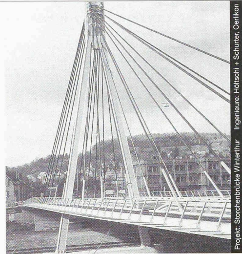
Projekt: Storchbrücke Winterthur Ingenieure: Höltschi + Schürter, Oerlikon

Nur mit diesem Baustoff sind die grössten Spannweiten möglich, dies mit Berücksichtigung der Wirtschaftlichkeit und des vorteilhaften Leistungsgewichtes. Stahl bietet eine nahezu unerschöpfliche Fülle von Möglichkeiten, Ihre Ideen zu verwirklichen.