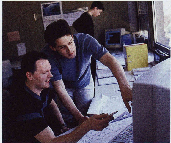
Die Zeichnerausbildung befindet sich im Umbruch. Das neue Berufsbildungssystem öffnet viel versprechende Perspektiven

Wie Eric Mosimann, Generalsekretär SIA, anlässlich des Treffens in Zürich ausführte, ist die künftige Ausbildung in den Zeichnerberufen auch vor dem Hintergrund der aktuellen Diskussion um das künftige Bachelor- und Mastersystem in den Hochschulen zu sehen. Mosimann stellte fest, dass die Zeichnerberufe dann wieder attraktiv sein werden, wenn auch die «Durchlässigkeit» in Bezug auf eine weiterführende Ausbildung klar aufgezeigt wird. Generell bildet die Lehre eine Grundlage für das berufliche Weiterkommen. Die begabten und ehrgeizigen Berufsleute sollten nicht einfach in andere Bereiche umschwenken müssen, um weiterzukommen. Die Branche sollte vermehrt darauf achten, sich den Berufsnachwuchs möglichst zu erhalten. Nebst der breiten Basisausbildung und der Spezialisie-