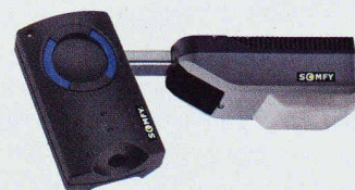
Axorn - Garagenautomatisierung mit neuester Funktechnologie

Komfort auch überzeugende Sicherheit. Wenn zum Beispiel ein Kindervelo oder Auto unbemerkt vom Bediener vor der Garage steht, ignoriert der Antrieb den Befehl oder stoppt das Tor und schützt so vor Schäden. «Axorn» gibt es für die gängigsten Modelltypen: Schwing-, Kipp- und Flü-