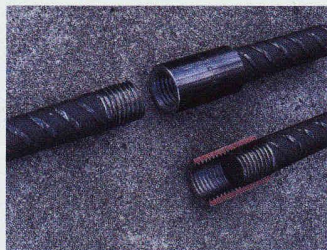
Bartec - System für geschraubte Betonstahl-Verbindungen

Hilfsmittel sind einfaches Handling und Montagefreundlichkeit gewährleistet. Zusätzlich erleichtern