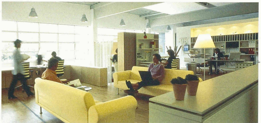
Das neue Vitra-Büro in Weil, eine Mischung aus Grossraum- und Zellenbüro, entstand unter Mitwirkung der Angestellten

gestaltet werden kann, zeigte die Vitra anhand ihrer eigenen Büroräumlichkeiten. Eine ursprünglich als Fabrikhalle gebaute, dann als Zellenbüro genutzte Fläche auf dem Vitra-Areal sollte neu konzipiert werden. Dafür engagierte Vitra die englische Innenarchitektin Sevil Peach. Sie entwarf einen Büroraum, den man als Synthese von Einzel- und Kombibüro auffassen kann. Zwischen territorialen und nichtterritorialen Arbeitsplätzen sind ein Café, Sofas, eine Bibliothek und ein Billardtisch eingestreut. Grundgedanke dieser Anordnung war, dass heute überall gearbeitet werden kann und dass die Beschäftigten selber entscheiden sollen, wo sie arbeiten wollen. Die Mitarbeiter wurden von Anfang an in den Planungsprozess mit einbezogen – ein wichtiger Faktor für die offenbar breite Akzeptanz des neuen Büros unter den Angestellten.