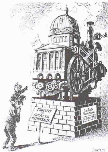
Patrick Chappatte: Prototyp der idealen Demokratie

Die Ausstellung wird ergänzt durch Printmedien aus den entsprechenden Zeiträumen, den Bö-Film von 1970 sowie Bücher mit Zusammenstellungen seiner Cartoons. Ein Teil der Ausstellung ist zudem dem Thema «Schweizer Eigensicht» gewidmet. Weitere Informationen: Karikatur- und Cartoon-Museum Basel, 4052 Basel, Tel. 061 271 13 36, Fax 061 274 03 36. Bis 3. Nov. www.cartoonmuseum.ch