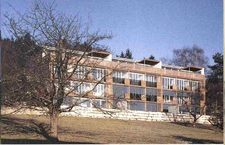
Die Siedlung Rüchlig in Stein bei Säckingen: Vorfabrikation im Passivhausbau ist machbar (Beitrag: René Birri)