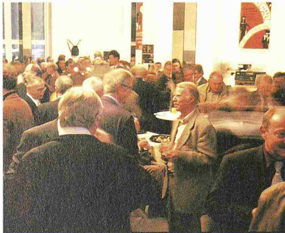
Ungezwungene Gespräche und reger Gedankenaustausch unter Gleichgesinnten

Gerade heute wo Politik, Wirtschaft und Gesellschaft über die einzuschlagenden Entwicklungspfade uneinig sind, braucht es einen starken Berufsverband: einen Berufsverband, der führend die nachhaltige Entwicklung im Umgang mit der Umwelt, der Wirtschaft und der Gesellschaft in Normen, Ordnungen und im Verhalten seiner Mitglieder gewährleistet, einen Berufsverband,