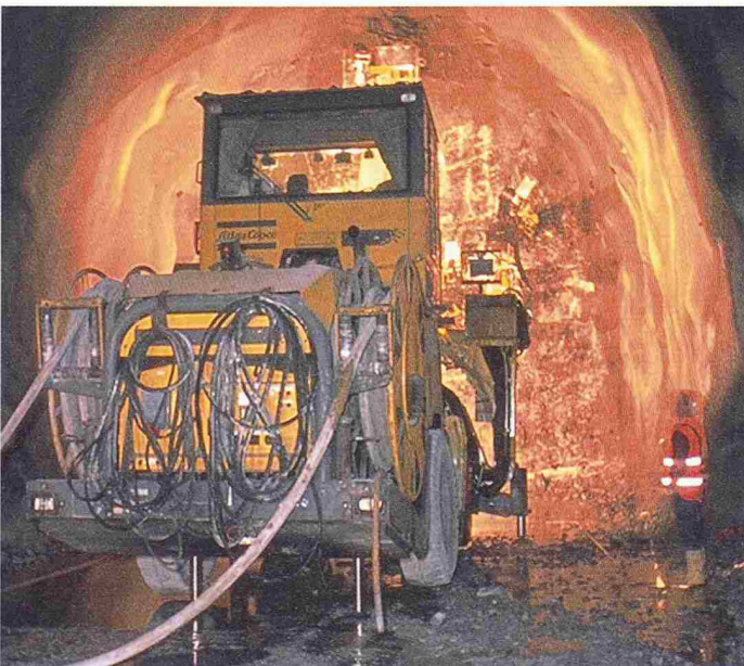
Tunnelbohrmaschine im Einsatz: Die Fachmesse für Untertagbau zeigte die Ausstellungsobjekte in realer Umgebung

Die unter dem Patronat der SIA-Fachgruppe für Untertagbau (FGU) im Versuchsstollen Hagerbach bei Sargans alle drei bis vier Jahre stattfindende Live-Messe entwickelt sich zum «Mekka» der Tunnel- und Untertagbauer. Im weitverzweigten, über 4 Kilometer messenden Tunnel- und Kavernennetz sowie auf einem 2000 m 2 grossen Freigelände präsentierte sich am 18. und 19. September die Tunnelbau-Branche mit Altbewährtem und mit interessanten Neuheiten. Als vermutlich einzige Fachmesse dieser Art bringt die IUT (Innovation unter Tage) sowohl Hersteller von Maschinen, Geräten und Baustoffen als auch Bauherren und Planer in echter Tunnelatmosphäre zusammen. Seit 30 Jahren wird im grössten Versuchsstollen der Schweiz geforscht, entwickelt und getestet. Die Betreiberin, die Versuchsstollen Hagerbach AG, ist eine private Aktiengesellschaft und muss selbsttragend arbeiten.