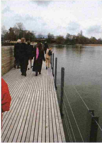
Fussgängersteg Rapperswil-Hurden: Hier gilt die SIA-Norm 358 nicht. Öffentlicher Raum ist Geltungsbereich der SN 640 568

Die Schweizerische Metall-Union (SMU) hat ein Abmahnungsformular für Geländer und Brüstungen erstellt. Das Ziel des Formulars ist es, dass die Auftraggeber normengerechte Geländer bestellen, andernfalls soll ein Haftungsausschluss des Metallbauers in Schandfalten erreicht werden.