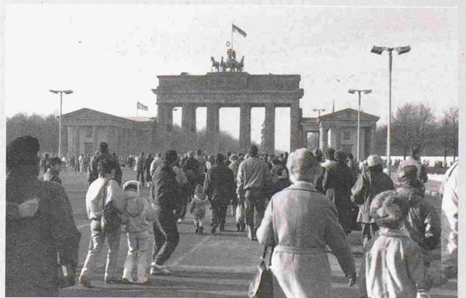
Nach dem Fall der Mauer im November 1989 entstand in Berlin entlang der ehemaligen Mauerführung ein riesiges Flächenpotenzial für Neubauprojekte (Bild: Brandenburger Tor kurz nach der Grenzöffnung Ost-West im Dez. 1989)

Bauten für die «neue» Mitte Berlins. Ebenfalls besichtigt werden die Geschäfts- und Wohnhäuser an der Friedrichstrasse wie beispielsweise das Kaufhaus Galeries Lafayette (Jean Nouvel) oder das Büro- und Wohnhaus Triangel (Josef Paul Kleihues), das Regierungsviertel (den Masterplan für die Bebauung entwarfen Axel Schultes und Charlotte Frank, die Kuppel des Reichstagsgebäudes entstand nach Entwürfen von Norman Foster). Zusätzlich kann morgens vor den Exkursionen der Workshop «Photoshop für Architektur-Fotografie» besucht werden. Das vollständige Programm und weitere Informationen sind erhältlich bei: Spectromedia, Tel. 01 380 38 38 oder www.architekturreisen.info .