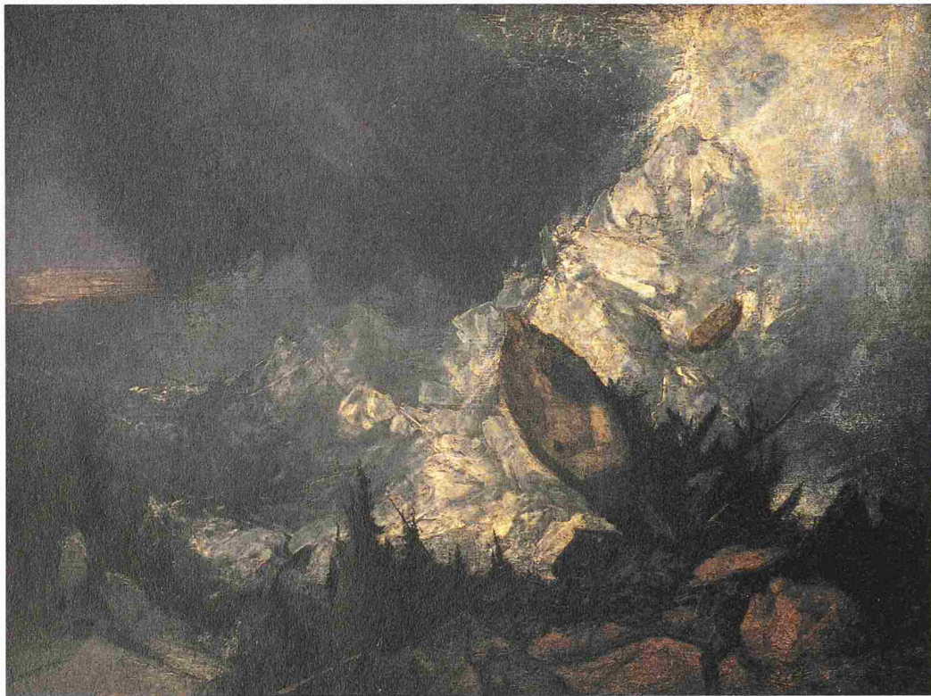
William Turner, Niedergang einer Lawine in Graubünden, 1810, Öl auf Leinwand 90 × 120 cm, Tate, London