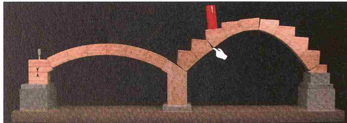
Statik anschaulich demonstriert an Tragwerksmodellen: Bei punktförmiger Belastung muss ein Bogen nicht nur Druck-, sondern auch Biegemomente (Zug und Druck) aufnehmen können (Bild aus dem besprochenen Buch)

Von Peter Schütz, Springer Verlag, 2002. 320 S., 330 Abb., Fr. 85.–. ISBN 3-211-83584-9