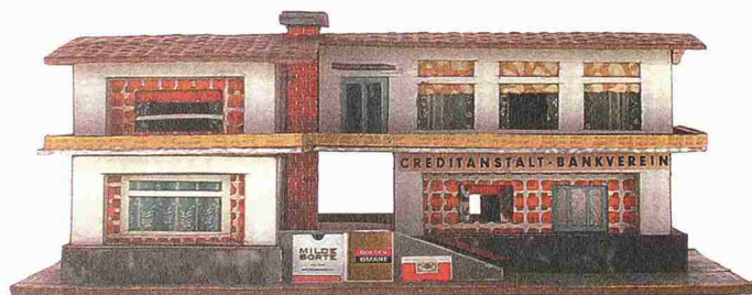
Peter Fritz: Creditanstalt – Bankverein. Nr. 56. 23,0 × 13,0 × 8,5 cm (Bild aus: O. Croy, O. Elser: Sondermodelle, die 387 Häuser des Peter Fritz, Osterildern-Ruit 2001)

Sondermodelle: Die 387 Häuser des Peter Fritz (vgl. auch tec21 27-28/2001, S. 31). Symposium der Fritz-Forschung vom 12. 1. 2002 in Kriens.