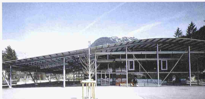
Erich Gutmorgeth, Lebensmittelsupermarkt Mpreis, Leutasch, Tirol (1998–99)

Die Ausstellung dauert noch bis 15.4.02 und ist täglich von 10 bis 19 h geöffnet.