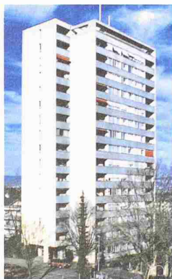
Graphika-Haus in Zürich vor (links) und nach der Sanierung 2001

Auch Hochhäuser kommen in die Jahre. Eine gelungene Erneuerung hat das Graphika-Hochhaus in Zürich hinter sich. Das Gebäude der Genossenschaft Graphika entstand zu Beginn der 60er-Jahre. In Zürich war der 43,5 m hohe Bau eines der ersten Hochhäuser des genossenschaftlichen Wohnungsbaus. Die Nutzfläche der Wohnungen war äusserst knapp bemessen. Mit der Sanierung wurde die Raumaussnutzung sowie die Wärmedämmung der Fassade verbessert. Die Raumlösung setzte ganz auf die Verglasung der Aussenräume. Mittels Glasfaltwänden, welche das Metallbauunternehmen Ernst Schweizer AG lieferte, wurden die Wohnzimmer in grosszügige Wohn-Esszimmer mit verglaster Veranda umgewandelt. Dafür wurde die alte Balkonbrüstung