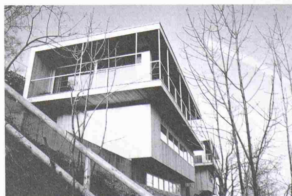
Ausgezeichnetes Projekt: Einfamilienhäuser Höhenweg, Speicher/AR Architekt: Daniel Cavelli, St. Gallen

Die Jury «Auszeichnung gutes Bauen 1996–2000» hat insgesamt acht Bauwerke ausgezeichnet und weitere sechs Anerkennend hervorgehoben. Die Ausstellung der ausgezeichneten Bauten empfängt die Besucher gleich im Eingangsbereich. Zudem sind mehrere Referate und Vorträge dem Thema Gutes Bauen gewidmet. Weitere Infos unter Tel. 052 722 44 55 oder www.immo-messe.ch .