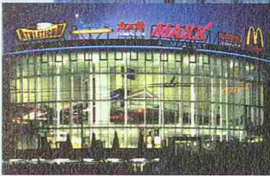
MaXX Filmpalast Emmenbrücke

Dahinter steckt unsere Liebe zur Präzision.