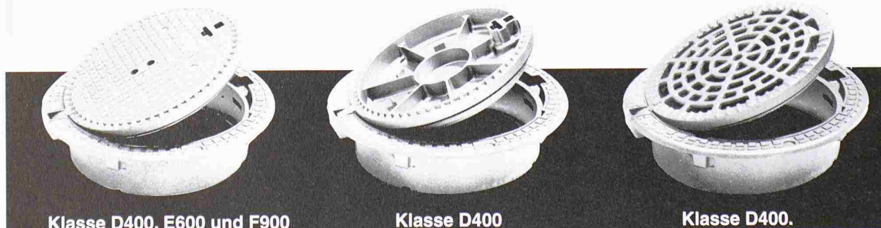
Klasse D400, E600 und F900

mit oder ohne Verriegelung (mit oder ohne Belüftungslöchern in D400).