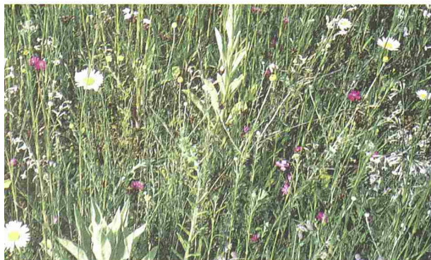
2 und 3

Verschiedene Substrate können bei gleicher Substratdicke und gleichen Ansaatmischungen zu ganz verschiedener Artenzusammensetzung führen