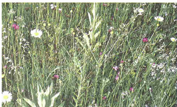
2 und 3

Verschiedene Substrate können bei gleicher Substratdicke und gleichen Ansaatmischungen zu ganz verschiedener Artenzusammensetzung führen