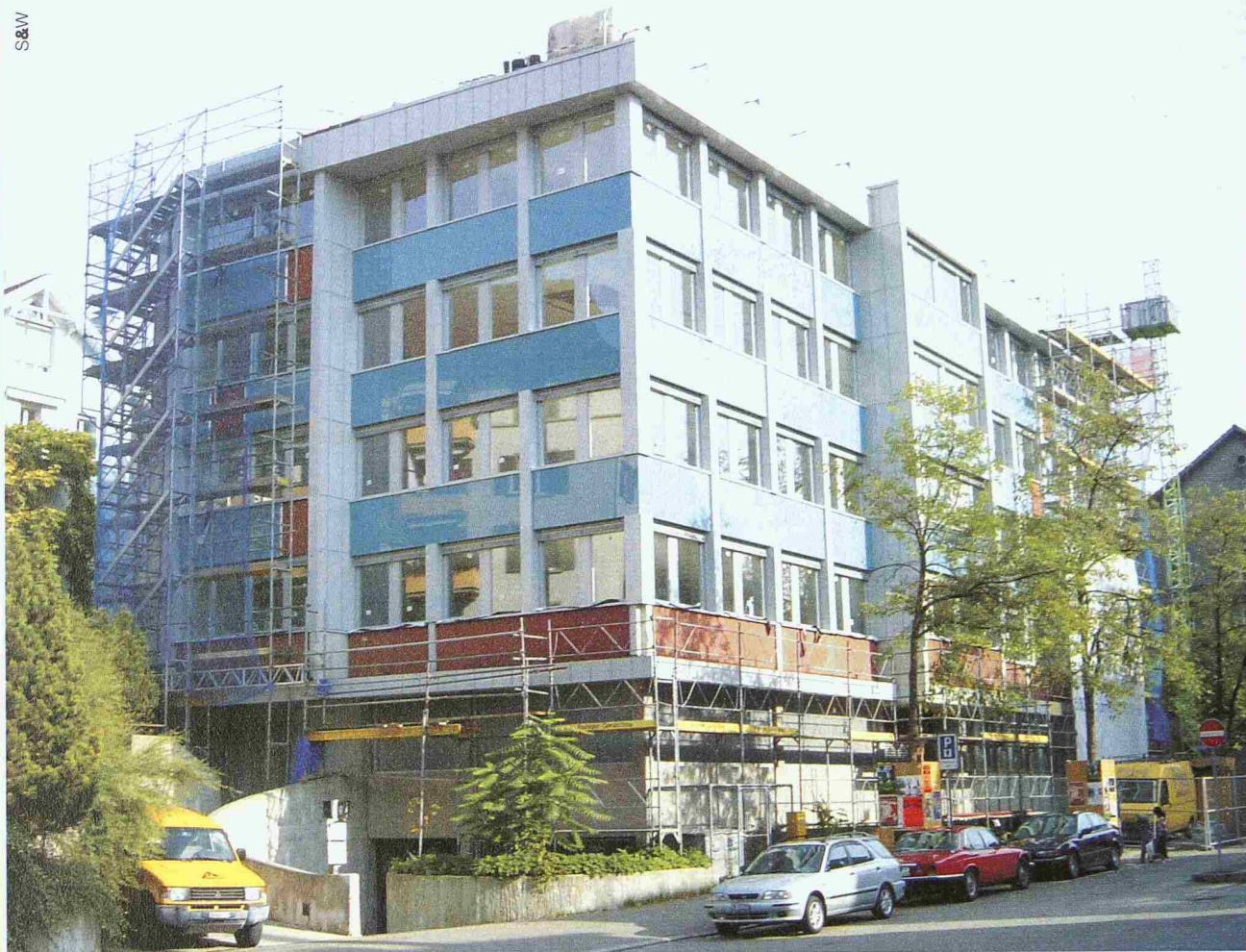
Geschäftshaus Höggerstrasse, Zürich