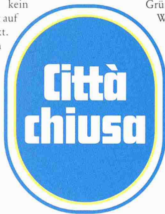
Das Logo des neuen wohnungspolitischen Bündnisses in Zürich