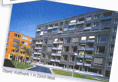
Objekt: Kraftwerk 1 in Zürich West