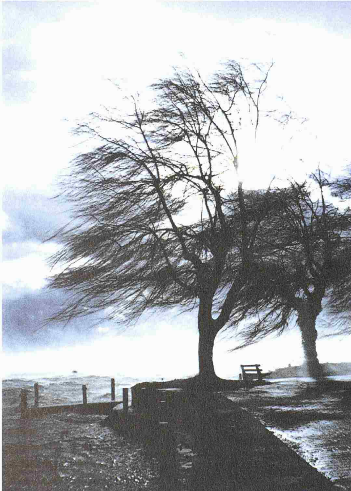
Bilder von Lothar, aufgenommen während und nach dem Jahrhundertsturm von 1999. Gesammelt in einem Wettbewerb der Hochschule für Holzwirtschaft in Biel (Bilder aus dem besprochenen Band)

(pd/mb) Am 26. Dezember 1999 fegte der Orkan Lothar über Europa; er forderte allein in der Schweiz 14 Menschenleben und richtete Schäden in Milliardenhöhe an. Ein neu erschienenes Bändchen versammelt Fotografien und Texte, die im Rahmen eines Wettbewerbes der Schweizerischen Hochschule für Holzwirtschaft in Biel zusammengekommen sind. Das Spektrum der Fotos reicht von forstbezogenen, sachlichen Dokumentationen bis zu Bildern, die uns über die Gewalt des Sturms, aber auch über seine bildhauerischen Qualitäten staunen lassen. Lothar – Der Jahrhundertsturm in Bildern. Stämpfli-Verlag, Bern 2002, 56 Seiten, 89 Abbildungen, sFr. 24.–, ISBN 3-7272-1326-4