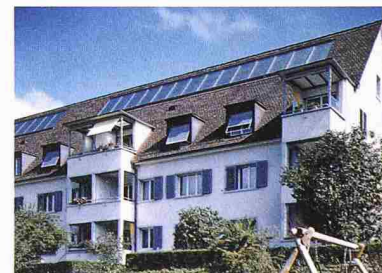
Die Baugenossenschaft Milchbuck heizt künftig das Warmwasser mit Sonnenenergie auf

In 16 Wohnsiedlungen in Zürich (Affoltern, Schwamendingen und Seebach), Niederhasli sowie Birmensdorf wird das Warmwasser in Zukunft mehrheitlich von der Sonne aufgeheizt. Im Rahmen einer Sanierung installiert die Baugenossenschaft Milchbuck im Jahr 2002 insgesamt 1000 m 2 Sonnenkollektoren auf den Dächern ihrer Liegenschaften. Damit lassen sich bis zu 60 Prozent des Warmwasserbedarfs von fast 1000 Wohnungen mit Energie von der Sonne decken. Die Wassererwärmung mit Sonnenkollektoren ist technisch ausgereift und erprobt, Liegenschaftsbesitzer setzen somit vermehrt auf die umweltschonende Heizmethode. Ernst Schweizer AG bietet Warmwasser-Solaranlagen in der Schweiz an und liefert beispielsweise auch die Module für die Baugenossenschaft Milchbuck. Ernst Schweizer AG, Metallbau 8908 Hedingen 01 763 61 11, Fax 01 761 88 51 www.schweizer-metallbau.ch