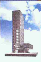
➔ Messeturm Basel